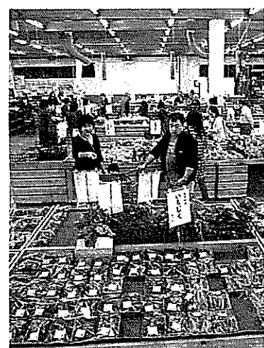
曜日を問わず買い物客でにぎわっている(愛知県大府市のJAあぐりタウン げんきの郷)

きた。JAすかがわ岩瀬(福島県須賀川市)の直売所「はたけんぼ」は、ちまきなど伝統的な料理の講習会を開いたり、学校給食のメニューを提案するといった活動を展開する。生産物を買うだけでなく、子供たちに食の大切さを伝えようとしている。